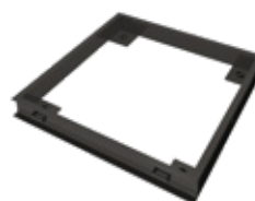
Cuvelage pour encastrer inox.