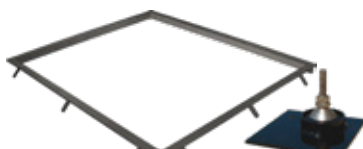
Encadrement de fosse inoxydable