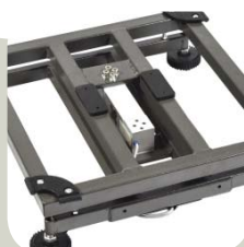
Structure tubulaire en acier peint