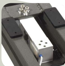
Cellule en aluminium avec protection IP65