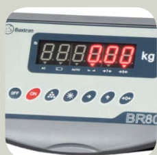
Affichage LED de 20 mm