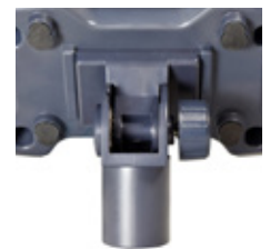
Coude adaptateur pour colonne