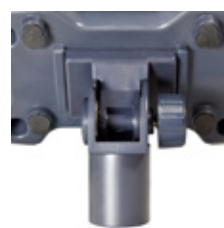
Support pour colonne