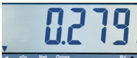
Écran LCD rétroéclairé