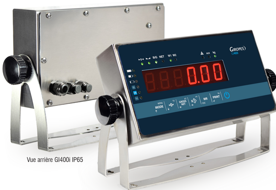
Vue arrière GI400i IP65