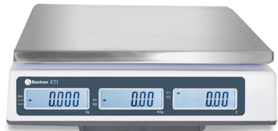
TROIS ÉCRANS ACHETEUR RÉTRO-ÉCLAIRÉES