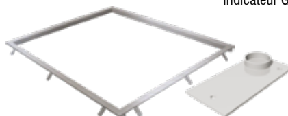
Encadrement de fosse inoxydable avec plaques d'ancrage