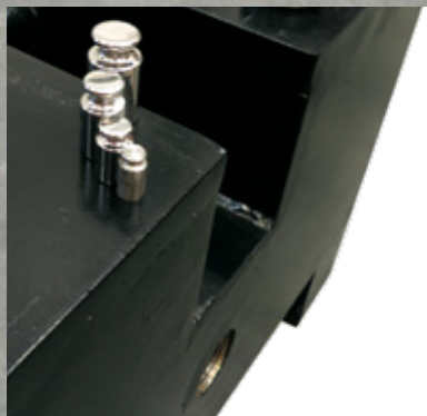
*Poids de calibrage non inclus

Poids individuels pour le calibrage des balances. Avec cavité de réglage latéral. Unités disponibles de 100 kg à 2000 kg.