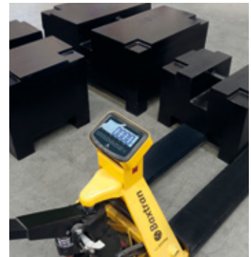
Conçu pour un transport efficace