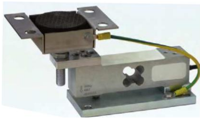
ACCESSOIRES DE MONTAGE POUR CAPTEURS AZL - AZS – AM

Ensemble Kits et Capteur pour Bascule, Cuves et Silot de 200 à 300 Kg.