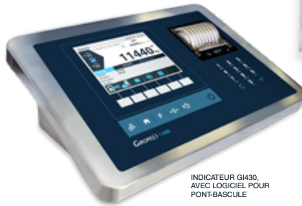
INDICATEUR GI430, AVEC LOGICIEL POUR PONT-BASCULE

INDICATEURS POIDS TARE ET MULTIPLES FONCTIONS