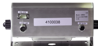
Vue arrière BR90