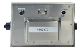
Vue arrière BR9040